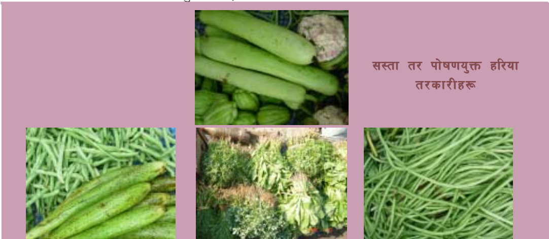
सस्ता तर पोषणयुक्त हरिया तरकारीहरू

फलफूल र हरियो तरकारी स्वास्थ्यवर्धक हुन्छन् । त्यसैले हाम्रो खानामा हामीले यसको बढी प्रयोग गर्नुपर्दछ । यसले हाम्रो रोगसँग लड्ने क्षमता वृद्धि गर्दछ । गाढा रङ भएका फलफूल र तरकारीहरू जस्तै: मेवा, आँप, सुन्तला, अमला, कर्कलो तथा अन्य, विभिन्न प्रकारका हरिया सागहरूमा भिटामिन पाइन्छन् । यिनीहरूले हामीलाई स्वस्थ राख्न मद्दत गर्दछन् । हरियो सागमा क्याल्सियम, म्याग्नेसियम, भिटामिन के (k) जस्ता तत्त्वहरू पाइन्छन् । यस्ता तत्त्वहरूले हाम्रा हाड, दाँत, छालाहरूलाई स्वस्थ बनाउँछन् । जसले गर्दा हामीलाई रोगसँग लड्न सक्ने शक्ति वृद्धि हुन्छ ।