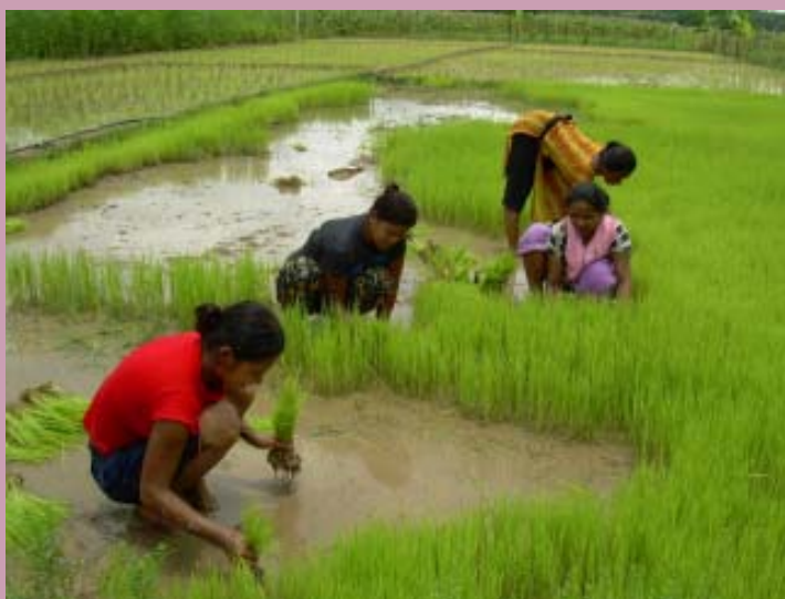
खेतमा काम गर्ने किसानहरूको त्यसमा पनि महिलाको अधिकार नहुनु