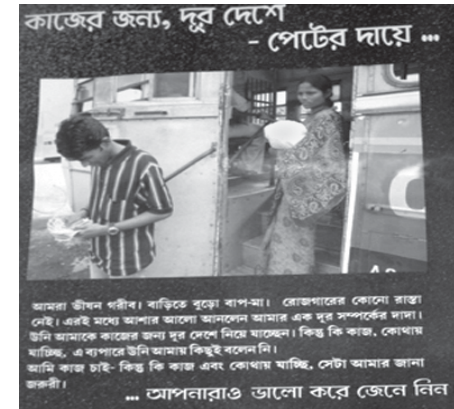
আমরা স্বীকৃত করি। বড়িকে বুকে বাপ-মা। রোজগারের কোনো সাক্ষ্য নেই। এরই মধ্যে আপনার আনন্দে আমাদের এক দূর সম্পর্কের দাম। উনি আমাদের কাজের জন্যে হ্র পেশে নিয়ে যাচ্ছেন। কিন্তু কি কাজ, কোথায় থাকি, এ ব্যাপারে উনি আমাদের কিছুই বলেন নি। আমি কাজ চাই- কিন্তু কি কাজ এবং কোথায় থাকি, সেটা আমার জানা জায়গা। ... আপনারাও ভালো করে জেলে নিল।

ভুল বুঝিয়ে, অত্যাচার করে, ক্ষমতার অপব্যবহার করে, দুর্বলতার সুযোগ নিয়ে, অথবা যার ওপর কর্তৃত্ব রয়েছে টাকা বা সুযোগ-সুবিধার লেনদেনের মাধ্যমে তার সম্মতি আদায় করে কোন শিশু, নারী, বা পুরুষকে সংগ্রহ করা, স্থানান্তরিত করা, হাতবদল করা, আটকে রাখা, বা নেওয়া। পাচারের প্রধান উদ্দেশ্য হল মানুষকে পণ্য হিসেবে ব্যবহার করা ও তাকে শোষণ করা।